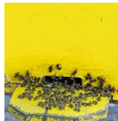
Biodling är också en del av verksamheten i Worancha och med moderna metoder ökar produktionen av honung för varje år.

fredsbyggande, traumabehandling för människor som genomlevt svåra konflikter, och andra humanitära insatser.