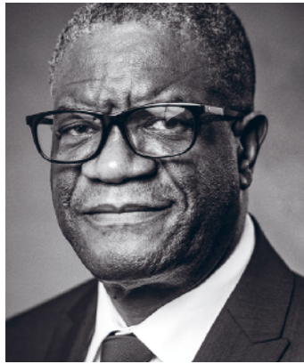
Doktor Denis Mukwege

– ny bok av Denis Mukwege om Kongos kvinnor.