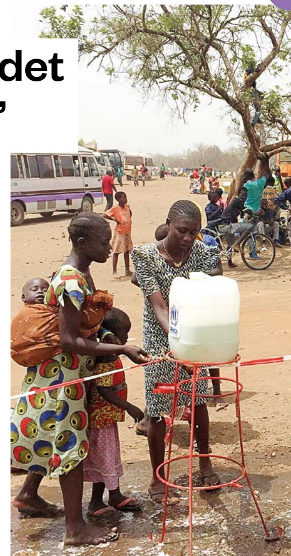
Det har inte regnat i Somalia Puntland på flera månader.

– Det är just nu värst i norra och södra delen av landet. Men även platser som tidigare haft vattenförsörjning är nu helt utan tillgång till vatten.