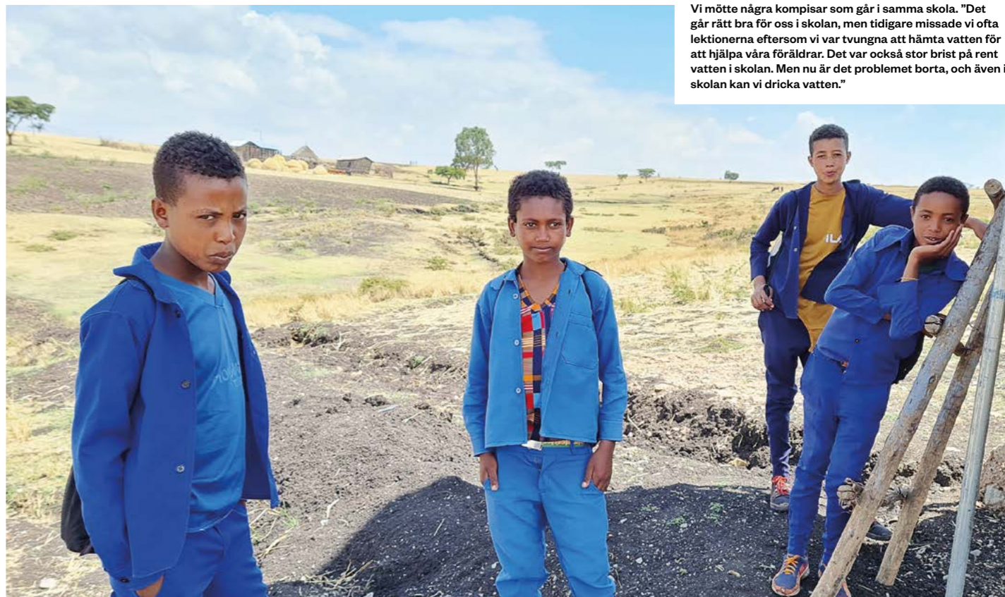
Vi mötte några kompisar som går i samma skola. "Det går rätt bra för oss i skolan, men tidigare missade vi ofta lektionerna eftersom vi var tvungna att hämta vatten för att hjälpa våra föräldrar. Det var också stor brist på rent vatten i skolan. Men nu är det problemet borta, och även i skolan kan vi dricka vatten."