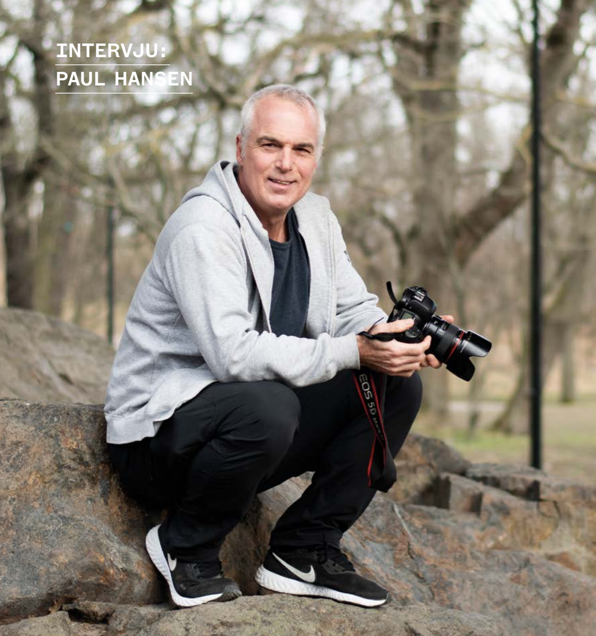
Paul ser sina bilder som visuella citat. Som när en solstråle tränger sig in och speglar sig i exakt rätt ögonblick och ger bilden extra nerv och skärpa. Eller när han lyckas fånga hoppet mitt i det mörka. "Jag älskar bilder som visar på livskraft."

jag kan skildra en historia som gör att andra människor skänker pengar eller om en artikel jag skriver får människor att se på flyktingar på ett annat sätt, då blir jag glad.