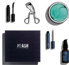
Du hittar Mama Care Package på www.xlash.se

Företaget XLash har gjort succé med deras serum för att stärka ögonfransar och ögonbryn. Och nu inleder de ett samarbete med Läkarmissionen för att låta delar av vinsten gå till att ge fler kvinnor en trygg och säker förlossning på sjukhus.