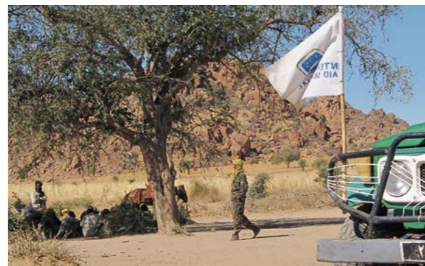
I Darfur-regionen har det interkommunala våldet fördubblats under andra halvan av 2020.

I Darfur-regionen har det interkommunala våldet fördubblats under andra halvan av 2020, med 28 incidenter jämfört med 15 mellan juli och december 2019. Enbart West Darfur-staten står för hälften av de 40 incidenter som rapporterats i hela Dar-