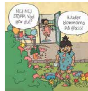
ILLUSTRATION: LOUISE EKLUND