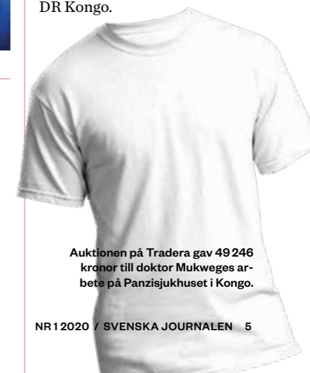
Auktionen på Tradera gav 49 246 kronor till doktor Mukweges arbete på Panzsjukhuset i Kongo.

Sammanlagt drog auktionen in 49 246 kr som går till 2018 års fredspristagare doktor Denis Mukweges och Läkarmissionens arbete på Panzsjukhuset i DR Kongo.