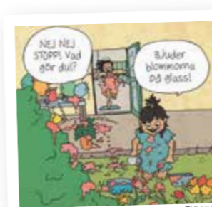
ILLUSTRATION: LOUISE EKLUND