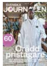
Doktor Denis Mukwege får Nobels fredspris 2018.