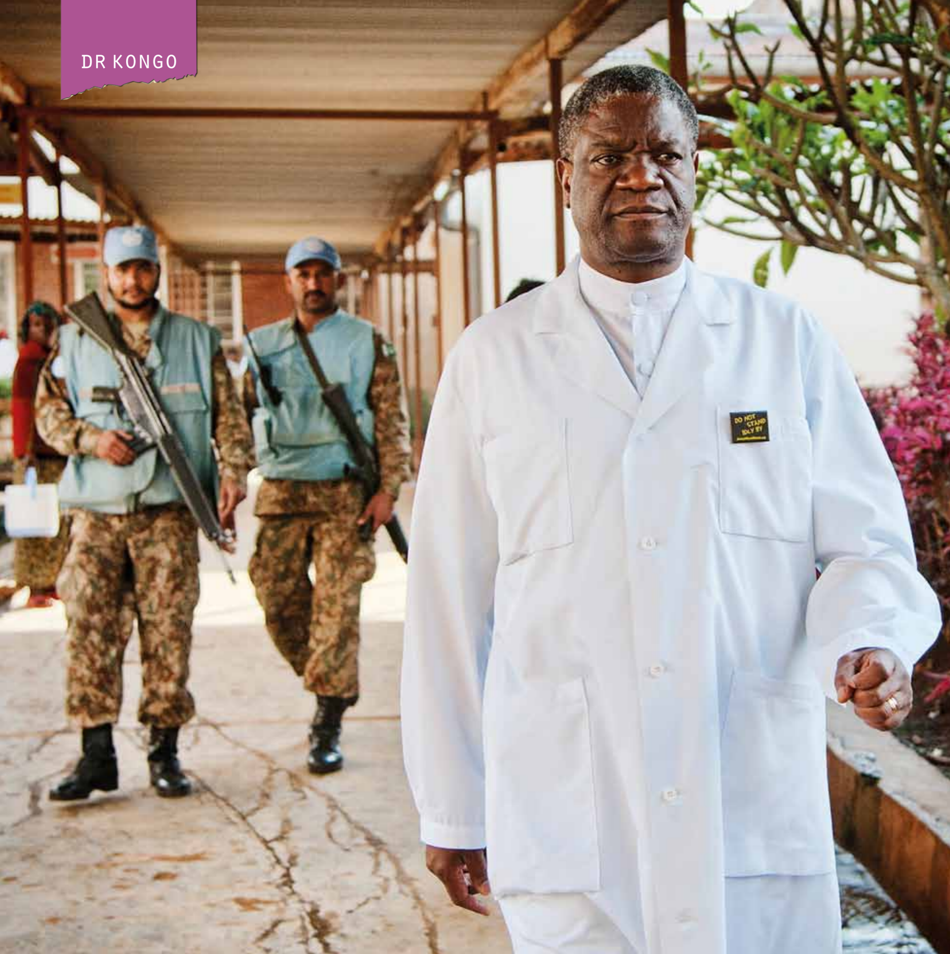
På grund risken för attentat bevakas Denis Mukwege av tungt beväpnade FN-soldater när han rör sig på sjukhuset.