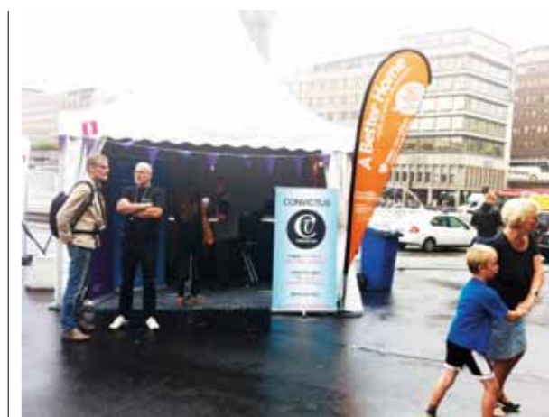
Representanter från "A better home" informerade på Stockholms kulturfestival i Stockholm om deras arbete bland romer.

– Här i Sverige har vi härbärgen där vi visar omsorg med boende, mat och kläder och det är en kristen handling. Men för en mer långsiktig hjälp i Rumänien arbetar vi även tillsammans med Läkarmissionen och deras partnerorganisation Liv & Ljus i Bukarest. Förhoppningen är att den modell de jobbar med där ska kunna spridas till andra städer i Rumänien, där många av de romer som