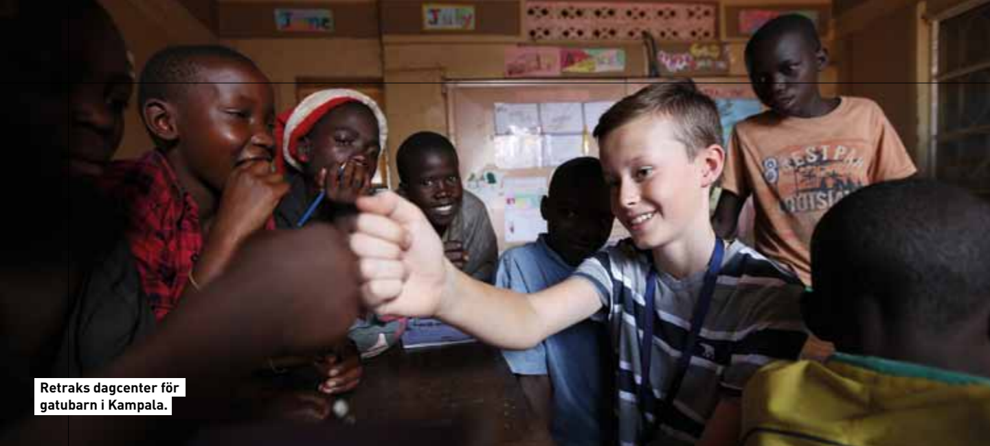
Retraks dagcenter för gatubarn i Kampala.