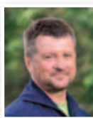
Stig Strand, världscupsegrare i slalom.

- Genom att äta VitaePro varje dag som en del av en sund kost kan jag bevara smidigheten i kroppen och känna att orken finns på plats i vardagen.