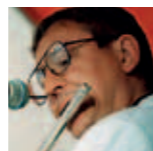
Björn J:son Lind.

Janne Schaffer är full av historier om berömda musiker. Han har ständigt befunnit sig i det musikaliska